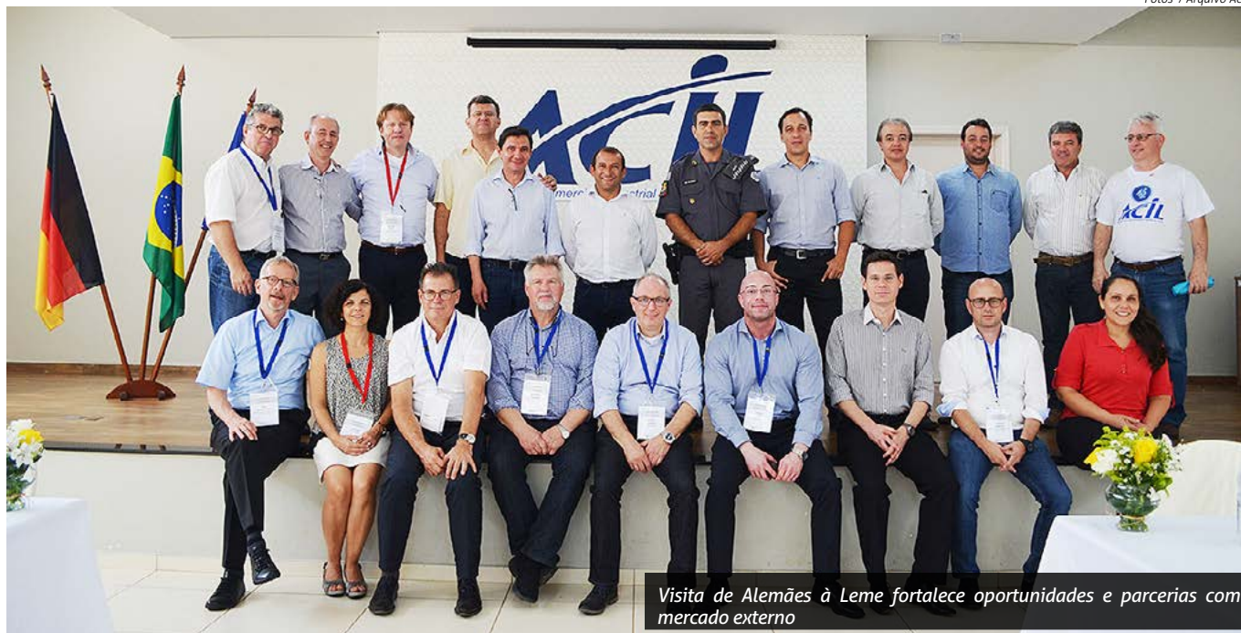
Visita de Alemães à Leme fortalece oportunidades e parcerias com mercado externo

A Associação Comercial, Industrial e Agrícola de Leme – ACIL é a principal representante do comércio e serviços no município e apresenta uma trajetória promissora em seus 45 anos de fundação, focada no desenvolvimento e qualificação de empresas e empresários da cidade.