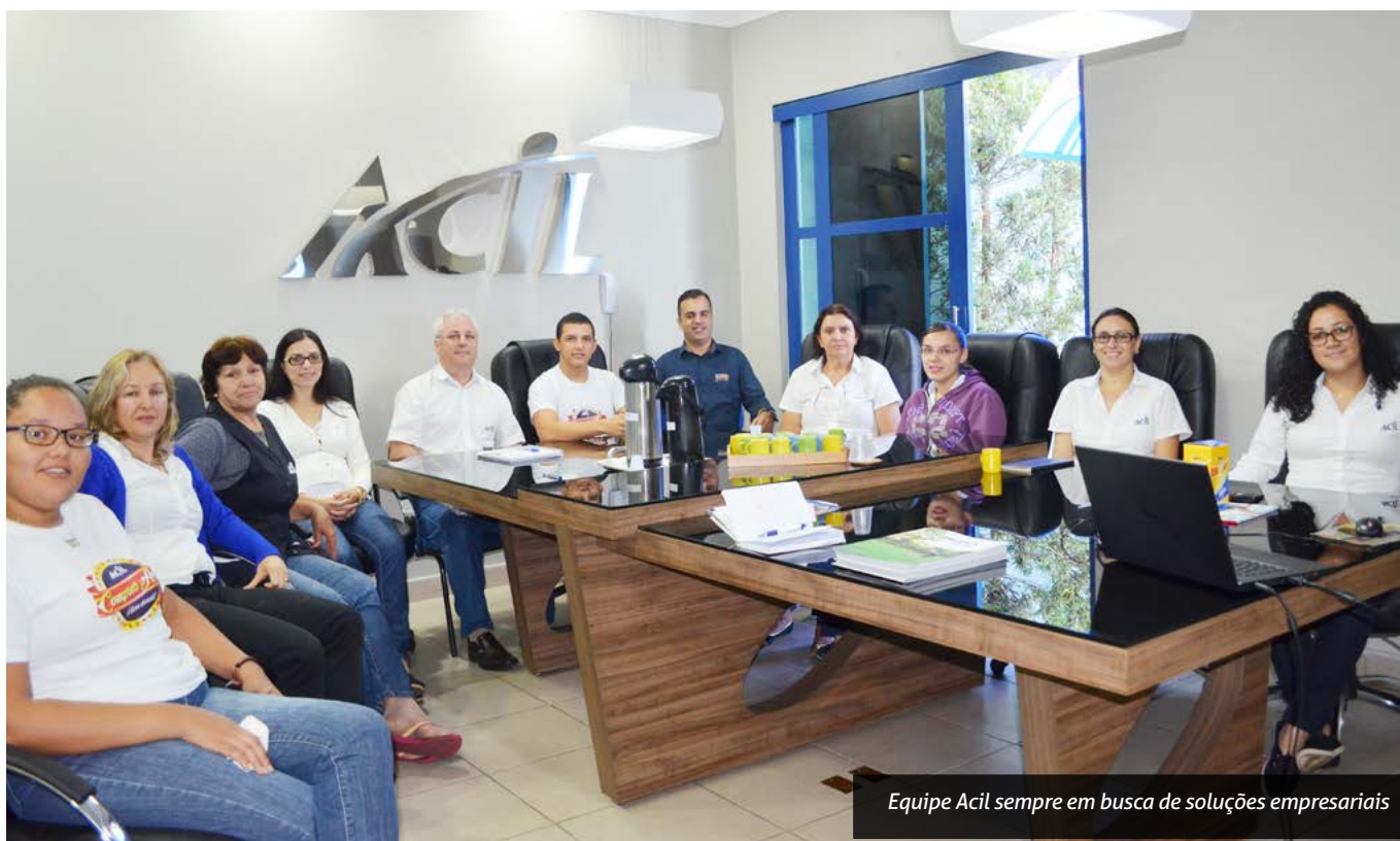
Equipe Acil sempre em busca de soluções empresariais