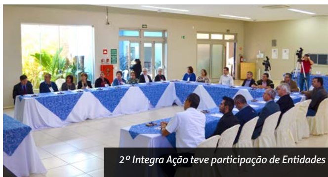
2º Integra Ação teve participação de Entidades