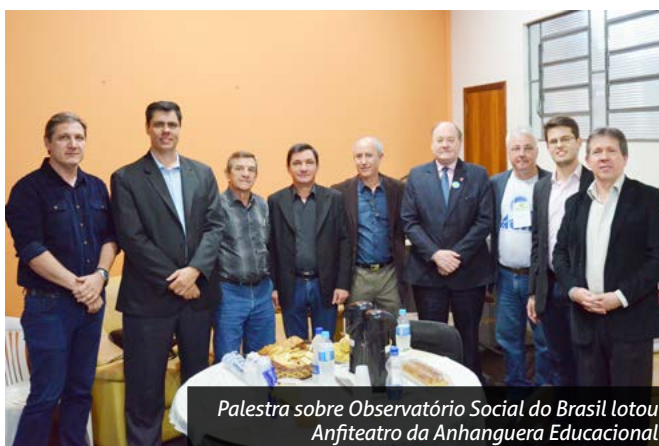
Palestra sobre Observatório Social do Brasil lotou Anfiteatro da Anhanguera Educacional