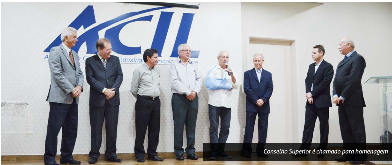
Conselho Superior é chamado para homenagem